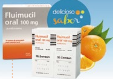
Sobres de 100 mg Caja x 30