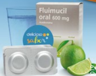
Tabletas de 600 mg Caja x 20