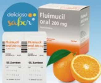
Sobres de 200 mg Caja x 60